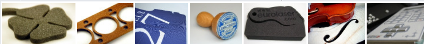
Schaumstoff Kork Bekleidungsindustrie Stempel Polyurethan-Schaum Musikinstrumente Bedienpanel