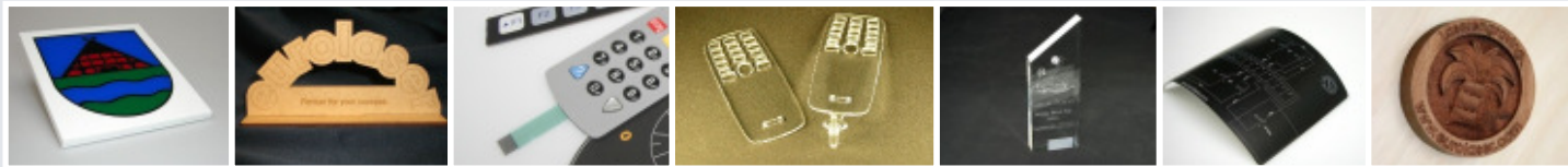
Farbiges Acryl MDF Folientastaturen Angussabtrennung Trophäen Individuelle Etiketten 3-D Gravur Holz