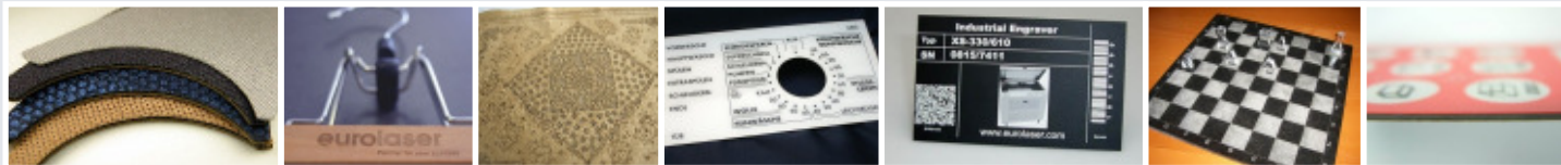
Verbundstoffe Holzgravur/Markieren Leder Frontblenden Beschichtetes Metall Granit Mehrlagige Folien