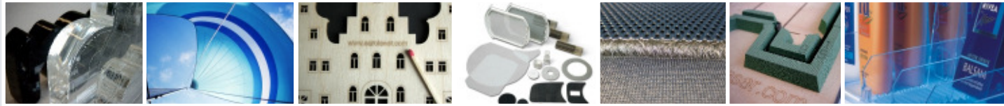
Displays Segeltuch Kunsthandwerk Filter Techn. Textilien Stanzformen Point Of Sale