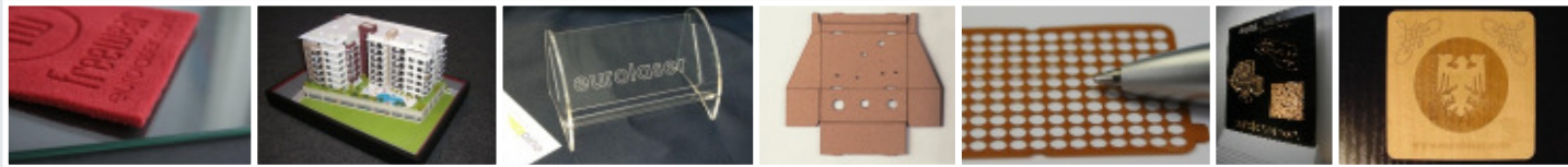
Vlies Architektur/Modellbau Büroartikel Verpackungen Folie Werbeschilder Furnier Intarsien