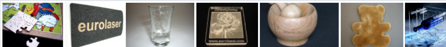
Spielwaren Nadelfilz Glas 3D-Gravur Acryl Rundgravuren Plüsch Geschenkartikel